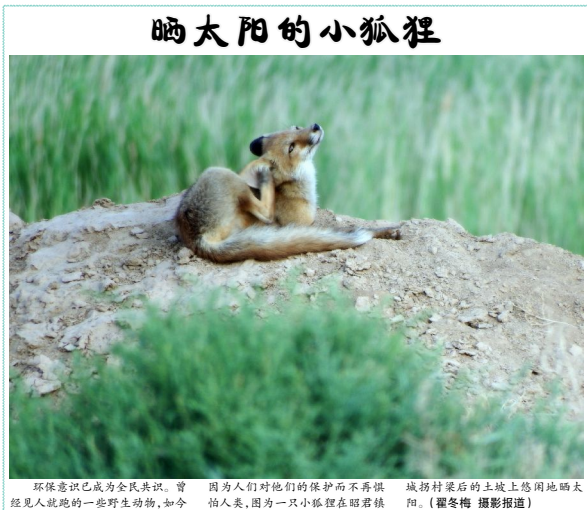
晒太阳的小狐狸 环保意识已成为全民共识,曾因人们对他们的保护和不再惧怕人类,因为一只小狐狸在昭君楼城村村梁上的土坡上悠闲地晒太阳。

据了解,本次驾驶员培训考试参与人群年龄在18-70周岁之间,四项考试科目均为免费。在考试过程中,考官严格执行考试程序和考核考场纪律,严格做到考试不合格不予发证。本次共有来自全旗各苏木镇共123名学员参加,经考核86名学员顺利通过,成为合格的驾驶员。此次培训有效地提高了农机驾驶员的理论素质和技术水平,为农机安全生产提供了可靠保障。