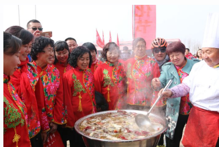
新时代,大伙儿共享全鱼宴