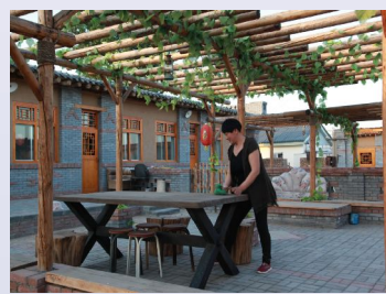
现代村居生活