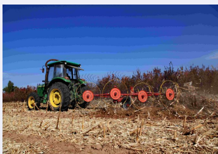
现代农业机械化作业