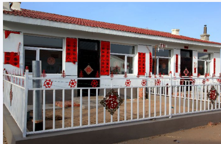
东海心新村