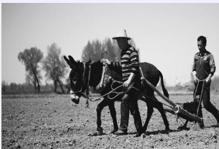
30年前种植玉米