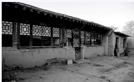
东海心旧村