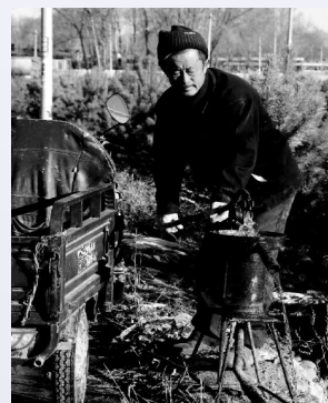
东海心村七十年代老水井