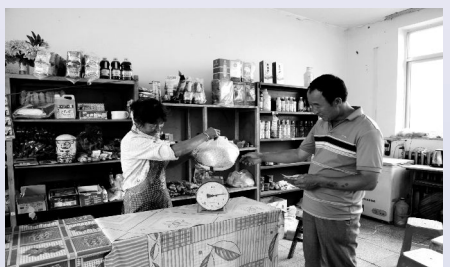
旧式小卖部