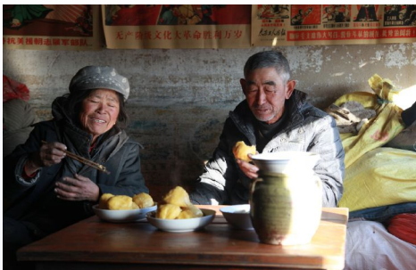
改革开放前农民吃玉米面窝窝

这些变化聚焦起来,最真实的写照就是照片。透过一张张老照片,我们看到40年间,勤劳的树林召镇儿女们用拼搏和汗水,奋进与奉献,在树林召这片大地上织就锦绣华章!