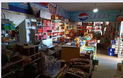
现代便民超市