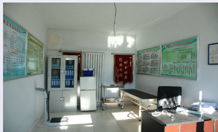
设备齐全的新卫生室