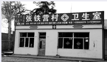
张铁营子村卫生室旧址