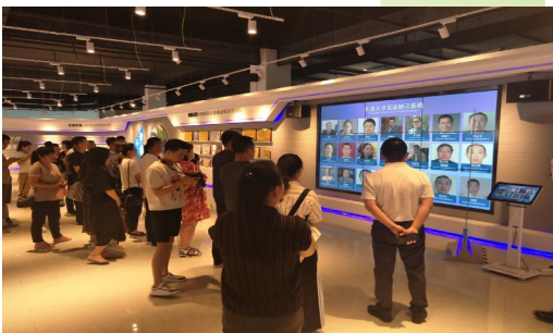
带领创业人员外出交流