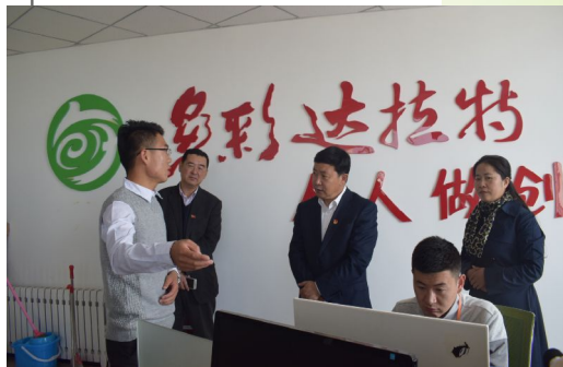
旗领导视察创业园