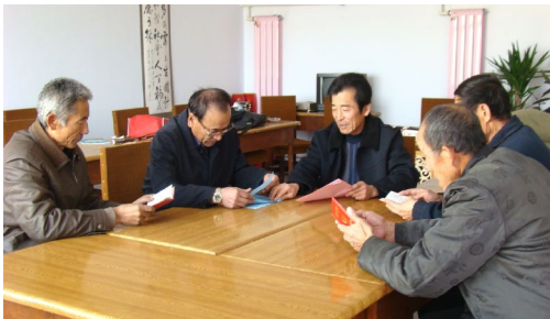
树林召镇五股地村“五老议事会”