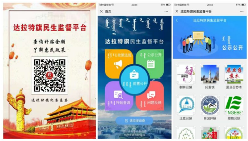
达拉特旗民生监督平台部分内容

2009年,我来到旗纪委工作,转眼间10年过去了,作为一名纪检干部,既深深感受到我们祖国经济全面繁荣,人民生活富裕祥和的变化,也切身感受到自己工作环境、工作方式的许多变化,其中十年前的“五老议事会”和如今的“民生监督平台”就是最好的对照,它们诠释了我国创新民主监督方式的密码和内涵。