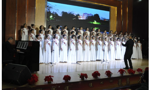
我旗关工委C大调合唱艺术团在舞台上表演新年音乐会。

关工委负责人表示,以合唱团的形式举办新年音乐会,希望能吸引更多的人加入到民族活动中,在丰富他们文化生活的同时,能够通过积极乐观的心态影响下一代人,关爱好下一代人。