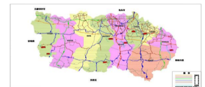
▲ 农村牧区公路建设项目示意图

2020年,我旗计划新建倒匠壕至王正壕、关展线至银肯敖包、X631 杨青线至联创集装站等3个重点公路项目,续建牧业队至X610、茶富沟至南布日嘎斯太、响沙湾至吉祥福聚寺(神龙寺)、柳沟村至水镜湖、西社至福源泉等5个重点公路项目。8个公路项目建设总里程86.13公里,总投资25229万元,项目计划2020年4月开工,2020年12月全部通车。