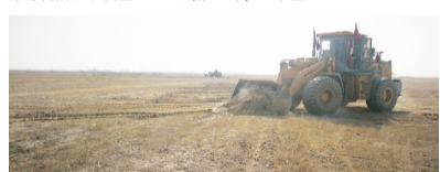
▲ 昭君镇5000亩井灌区盐碱地改良示范土地平整

项目总投资为4400万元,全部为自治区投资资金。建设期限2020年—2022年。