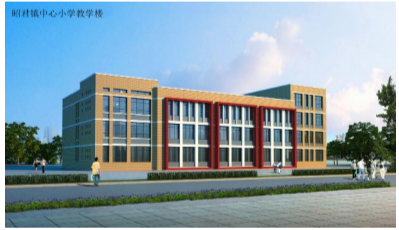
▲ 昭君镇中心小学新建教学楼2941平方米,总投资940万元

二、恩格贝镇中心小学改扩建项目总投资1160万元,总建筑面积3861.4平方米(新建教学楼、宿舍)。项目于2019年8月开工建设,当年新建学生宿舍已完工,新建教学楼已封顶;2020年4月,项目复工,正在进行教学楼二次结构施工,计划秋季开学前建成投用。