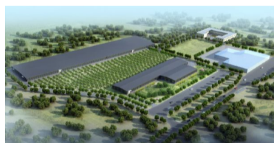
▲ 两宜生物年产10万吨固体生物有机肥项目鸟瞰图

内蒙古两宜生物科技有限公司年产10万吨固体生物有机肥项目,规划建设15000平方米生产车间、10万吨生产线,新建科研办公楼4100平方米以及相关配套设施。项目总投资1.3亿元,计划于2020年12月底建成投产。