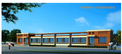
▲ 中和西镇中心小学新建学生宿舍885平方米,总投资273万元

一、我旗农村牧区义务教育学校薄弱环节改善与能力提升工程规划总投资2153万元,总建筑面积6767平方米(吉格斯太镇中心小学新建教学楼2941平方米,昭君镇中心小学新建教学楼2941平方米,中和西镇中心小学新建学生宿舍885平方米)。