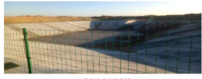
▲ 项目建成的氧化塘

项目建成后,全旗畜禽粪污资源化利用率将达到85%,大型规模化养殖场设施配套率将达到100%,我旗粪污收集处理体系基本完善,将促进形成农牧结合、种养循环的农业可持续发展机制,为旗农牧业绿色可持续发展增添新动力。