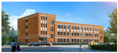
▲ 吉格斯太镇中心小学新建教学楼2941平方米,总投资940万元