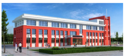
▲ 恩格贝镇中心小学改扩建项目——新建教学楼

二、恩格贝镇中心小学改扩建项目总投资1160万元,总建筑面积3861.4平方米(新建教学楼、宿舍)。项目于2019年8月开工建设,当年新建学生宿舍已完工,新建教学楼已封顶;2020年4月,项目复工,正在进行教学楼二次结构施工,计划秋季开学前建成投用。