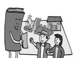
6 征收农村集体土地怎样补偿?

《民法典》与新《土地管理法》相衔接,完善了被征地农民的补偿制度,在原有地上补偿费、安置补助费、地上附着物和青苗的补偿以及社会保障费用的基础上,增加村民住宅补偿费用作为法定的补偿范围,而且明确要及时足额支付。