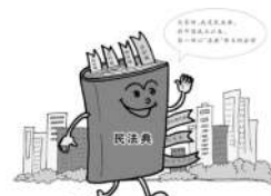
1 如何理解绿色原则?