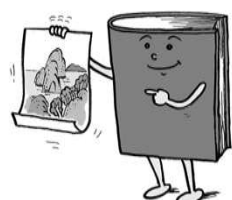
2 我国的自然资源归谁所有?

《民法典》将居住权人纳入用益物权的范围,明确居住权原则上无偿设立,居住权人有权按照合同约定使用或者租赁,占有、使用他人住宅,为“以房养老”等多主体供给、多渠道保障的住房制度改革提供法律保障。