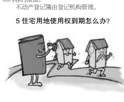
5 住宅用地使用到期怎么办?

针对近年来社会民众普遍关心的住宅建设用地使用权到期如何续期以及续期是否缴费等问题,《民法典》进行了明确,为保障群众“产有所居”下定“定心丸”。至于续期费用具体如何缴纳和减免,在《城市房地产管理法》修改中将会作出进一步明确的規定。