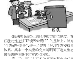
9 污染、破坏生态环境怎么赔偿?

第一千二百三十五条违反国家规定造成生态环境损害赔偿的,国家规定的机关或者法律规定的组织有权请求侵权人赔偿下列损失和费用: (一)生态环境受到损害至修复完成期间服务功能丧失导致的损失; (二)生态环境永久性损害造成的损失; (三)生态环境调查鉴定费用; (四)清除污染、修复生态环境的费用; (五)防止损害的发生和扩大所支出的合理费用。