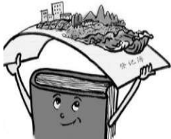
4 如何理解不动产统一登记?

《民法典》贯彻不动产统一登记改革精神,将《物权法》和《不动产登记暂行条例》的有关内容整合后写入《民法典》,进一步聚焦产权人合法权益保护。