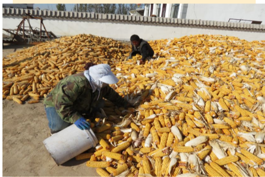
金秋十月,硕果累累,达拉特的田间地头处处洋溢着丰收的喜悦。笔者在恩格贝镇的部分村社看到,村民们有的忙着收割玉米,有的正在晾晒玉米。据了解,今年降雨量充足,玉米产量稳定,价格也较往年高一些,村民们喜在心里,笑在脸上。